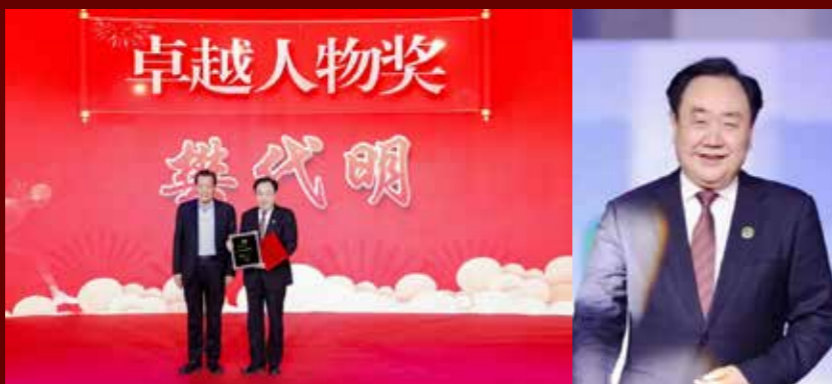
樊代明，中国工程院院士，中国抗癌协会理事长，美国医学科学院外籍院士，法国医学科学院外籍院士

颁奖词：他身为院士，以70岁的高龄，编撰了中国首部“CACA指南”。汇聚了1万3千名专家倾情付出，3000万字鸿篇巨制，连续15个月、横跨33个省市、整整100场不同内容的全国推广活动，总行程逾27万里，总影响26亿人次。