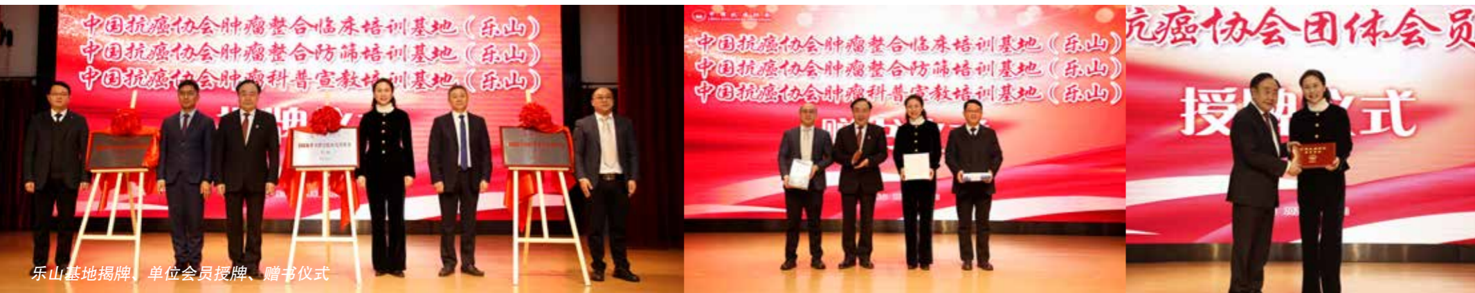
乐山基地揭牌、单位会员授牌、赠书仪式