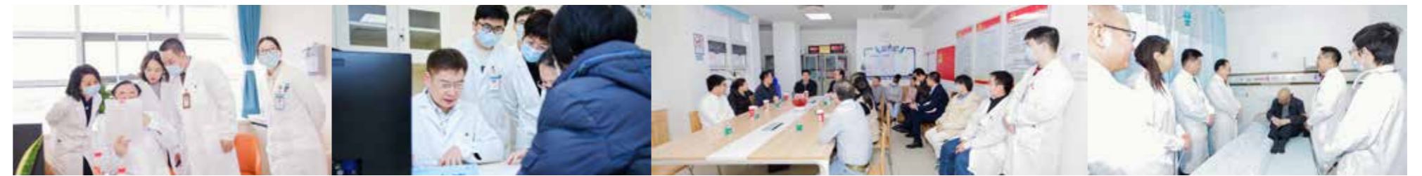
针对疑难病例开展查房、会诊及指导工作

“今天是一个具有纪念意义的日子,它预示着南方医科大学顺德医院将在肿瘤的整体防治、