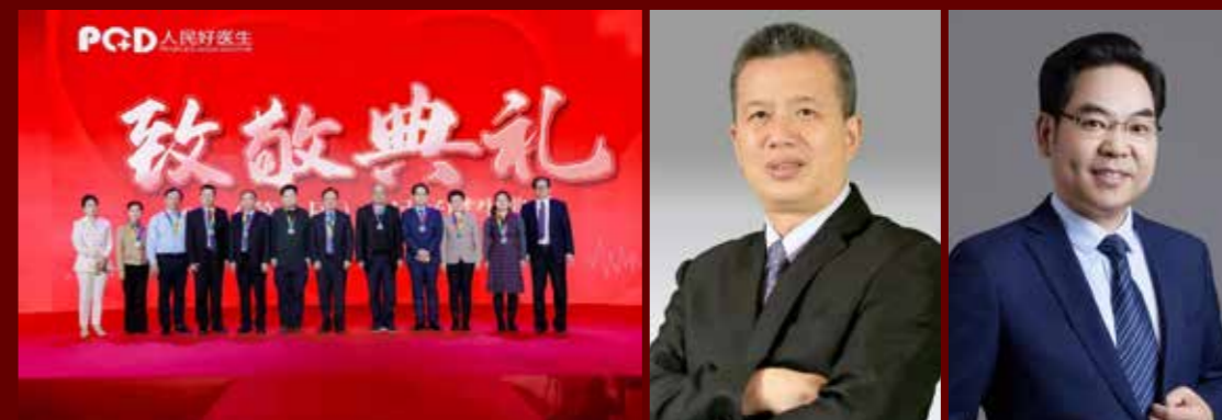
陈敏山，教授，中山大学肿瘤防治中心肝脏外科主任，中山大学肝癌研究所所长，中国抗癌协会肝癌专委会主委