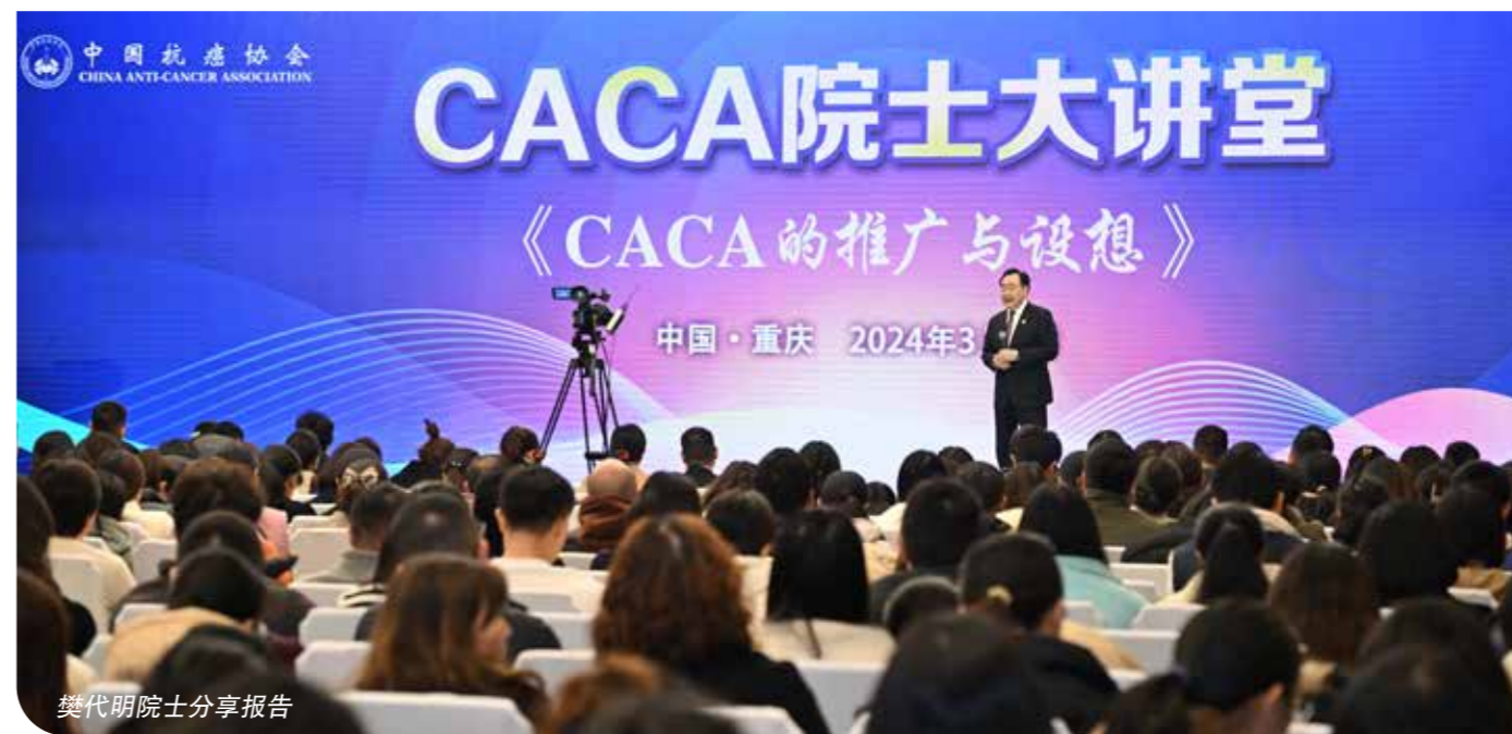
樊代明院士分享报告

随后樊代明院士为大家深入分享了人体的7种自然力”自主生成力、自相耦合力、自有代谢力、自发修复力、自控平衡力、自我保护力、精神统控力。CACA