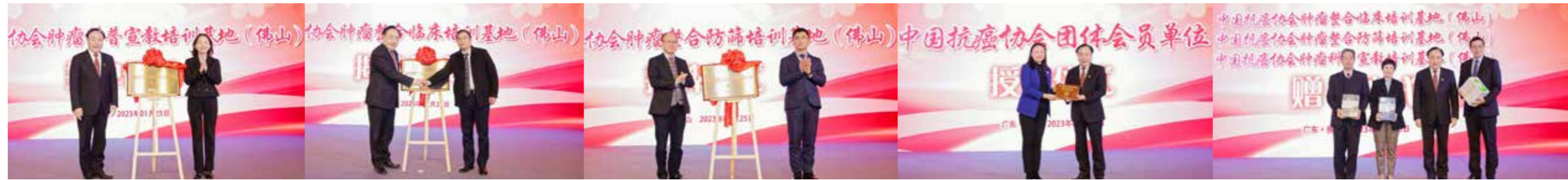
佛山基地揭牌、单位会员授牌、赠书仪式

1月25日,由中国抗癌协会、新华网主办,南方医科大学顺德医院、新华网客户端及中国抗癌协会肿瘤防治科普专业委员会承办,佛山市医师协会和顺德区医学会协办的“健康中国在行动暨CACA指南中国行(佛山站)”活动在南方医科大学顺德医院成功举行。