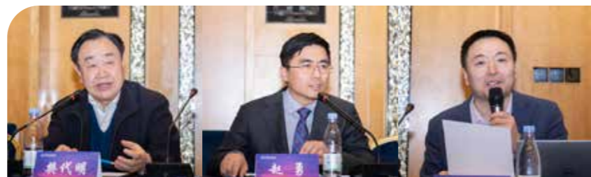
樊代明理事长发言

樊代明院士强调了 CACA 指南进校园活动的重要性，指出当前医学教育存在教材更新