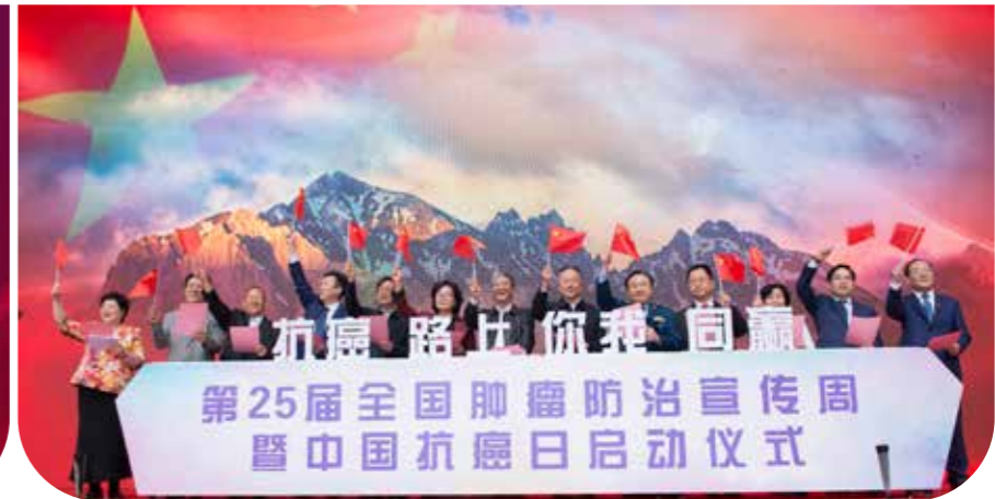
第25届全国肿瘤防治宣传周启动仪式

作为首席专家，创建“整合肿瘤学”全国科学传播专家团队，开展一系列科学防癌科普宣传工作；