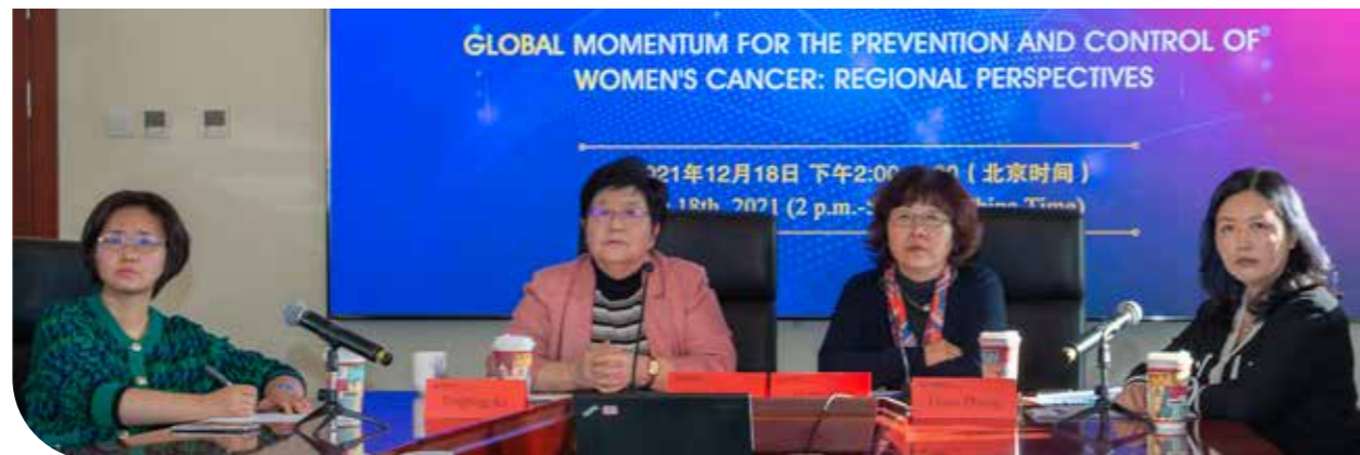
中国抗癌协会会议现场