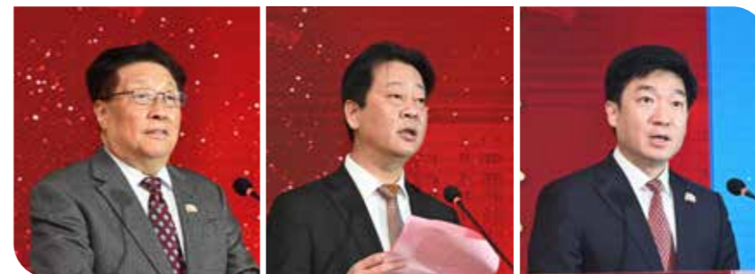
天津市肿瘤医院研究所所长郝希山院士

百六十年，初心不变。站在新的历史起点上，回望来时奋斗路，奔赴前方奋进新征程，作为中国肿瘤防治研究领域的国家队，天津医科大学肿瘤医院用理想信念之光照亮高质量发展的奋进之路，矢志不渝助力中国癌症防控事业发展，向世界传递天肿声音，谱写浓墨重彩新篇章。CACA