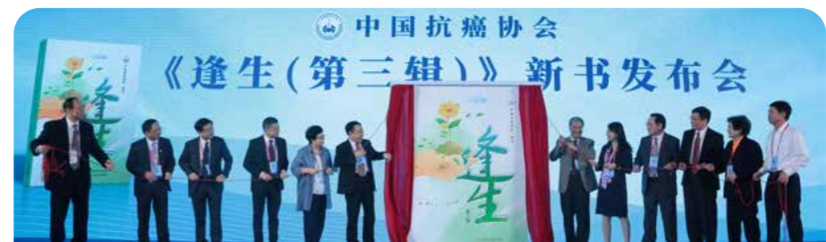
《逢生（第三辑）》新书发布会

他的报告《三千年医学的进与退》曾在2016年首都高校科学道德和学风建设宣讲教育报告会上引起强烈反响；CCTV《科学养生 远离癌症》系列访谈节目热播，获得广泛欢迎；《整合健康学》报告登上北京卫视“养生堂”节目成为网红；他以百度搜索年度3.3亿的影响人次荣获2021年度“百度健康科普传播奖”。CACA