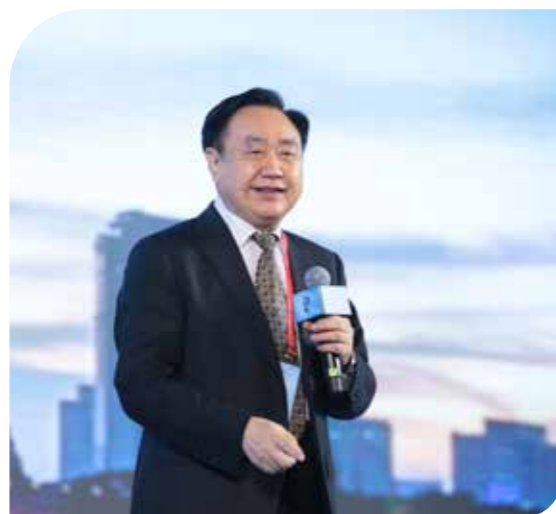
2020年中国肿瘤学科普大会

据悉，该奖项每5年评选一次，2021年在全国范围内表彰积极投身全民科学素质建设，开拓创新、拼搏奉献，担当作为、合力攻坚，为推进全民科学素质工作作出突出贡献的先进个人205人，中国科协系统仅有6位获此殊荣。