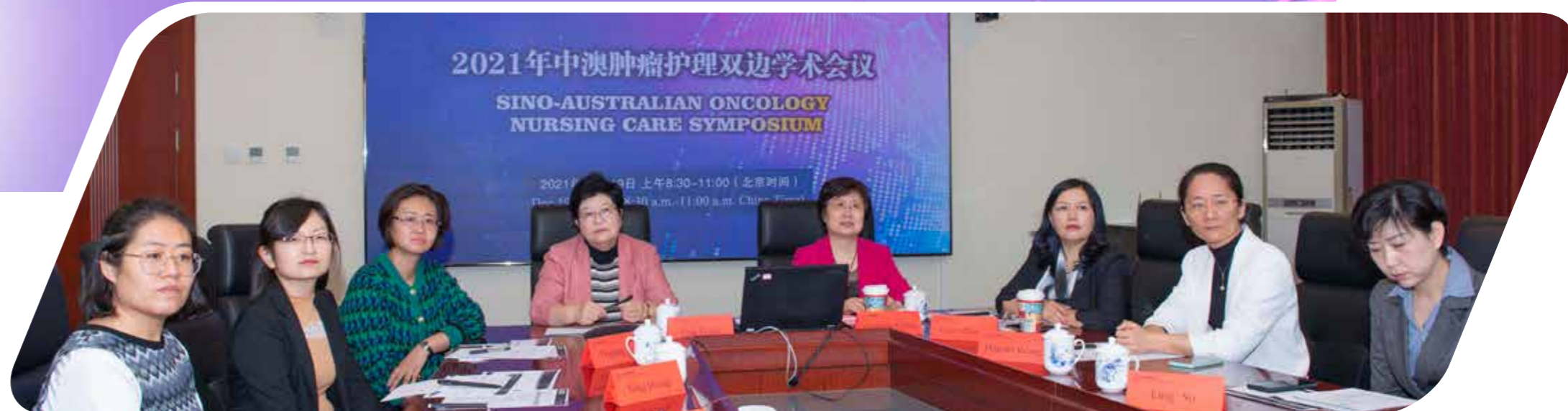
中国抗癌协会会议现场

2021年12月19日，由中国科协“一带一路”国际肿瘤专业人员联合培训中心、中国抗癌协会、澳大利亚ICON医疗集团联合主办的2021年中澳肿瘤护理双边学术会议成功在线召开。会议现场直播，中国、澳大利亚有近3.7万人次在线观看。