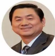
大会荣誉主席 陈志南院士 空军军医大学