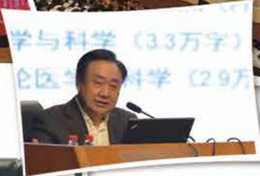
中国抗癌协会理事长樊代明院士做《医学的系统论与整合观》报告