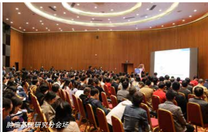
肿瘤基础研究分会场