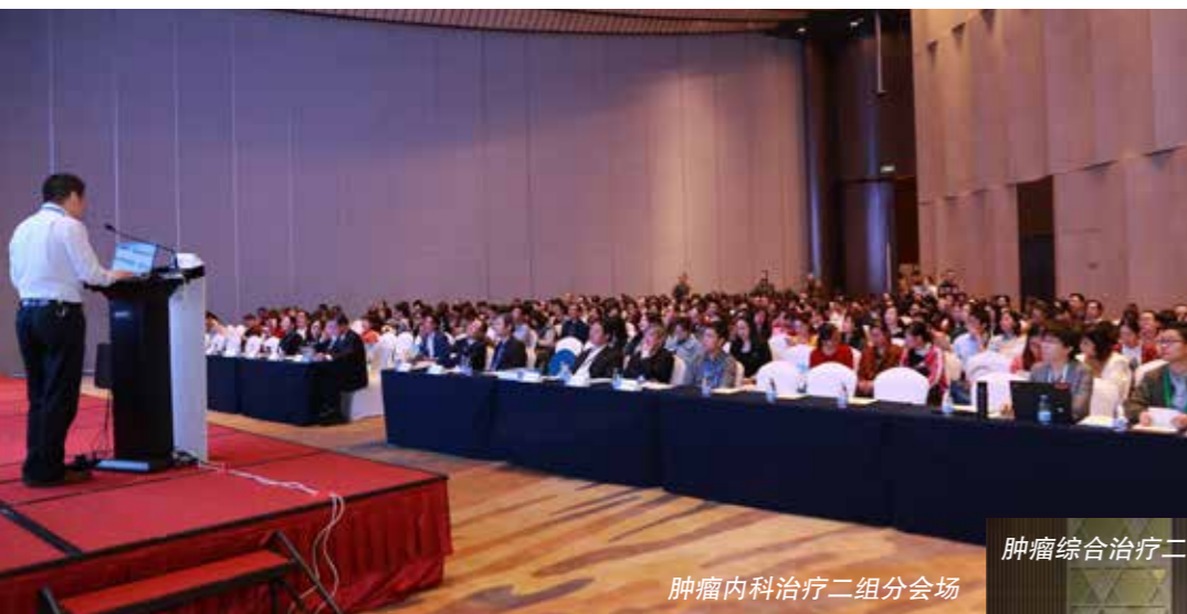
肿瘤内科治疗二组分会场