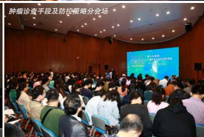
肿瘤诊断手段及防控策略分会场