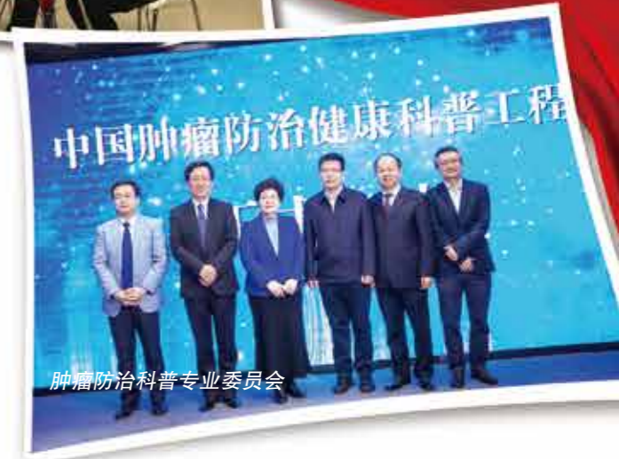
肿瘤防治科普专业委员会