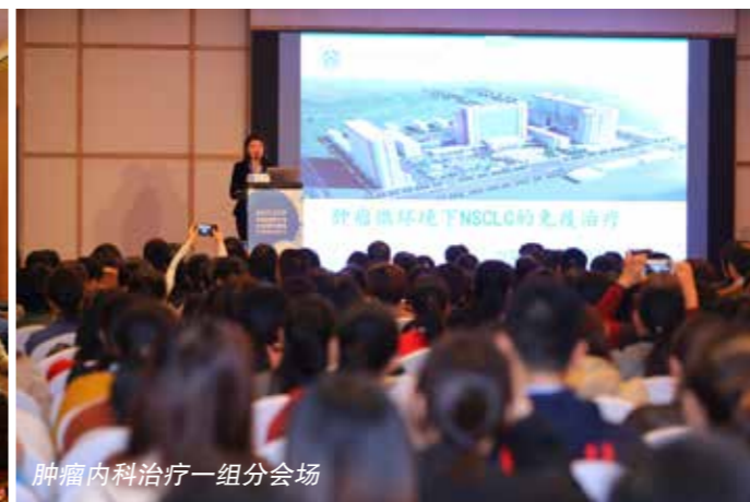
肿瘤内科治疗一组分会场