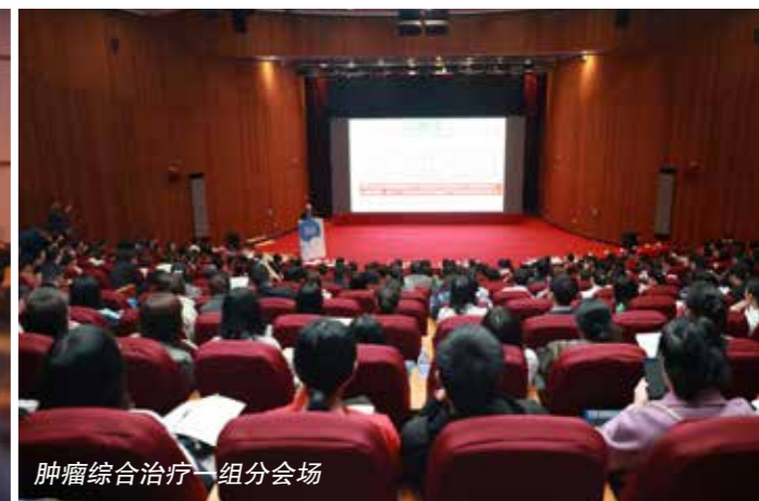
肿瘤综合治疗一组分会场