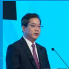
上海交通大学医学院附属第九人民医院 范先群教授