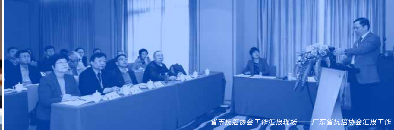
省市抗癌协会工作汇报现场——广东省抗癌协会汇报工作