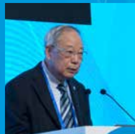
上海市质子重离子医院 蒋国梁教授

大会主旨报告遴选总决赛拉开帷幕。活动邀请27位专家、通过评审专家打分和讲座专家互评相结合的方式遴选。16位讲座专家依次登场，为大家奉献一场精彩纷呈的前沿学术报告。经过紧张角逐，最终8名专家胜出，成为2019年CCO大会主旨报告人。