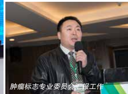
肿瘤标志专业委员会汇报工作