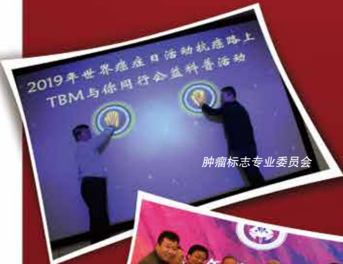
肿瘤标志专业委员会

世界癌症日前后，陕西、浙江、辽宁、北京、天津、广东、四川、重庆、湖北、甘肃、青海、内蒙古等省市自治区纷纷举办隆重的启动活动，揭开了世界癌症日活动的序幕。各地活动充分调动医护人员、康复会患者、社会公众的参与热情，组织有序、规模宏大、形式活泼创新。中国抗癌协会肿瘤标志、中西医整合肿瘤专业委员会等专业委员会、全国各地青年理事会及中国抗癌协会康复会成员积极参与，向全社会展示了全国癌症患者乐观积极战胜癌症的信心和勇气。