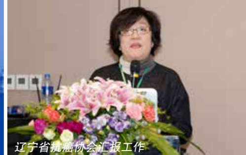
辽宁省抗癌协会汇报工作