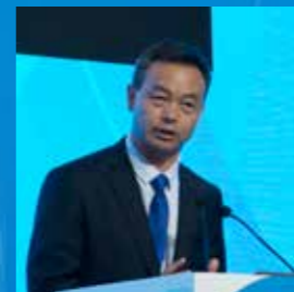
海军军医大学 曹广文教授