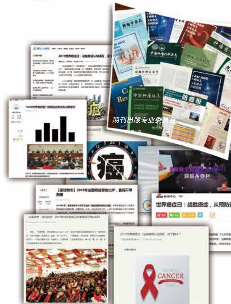
期刊出版专业委员会