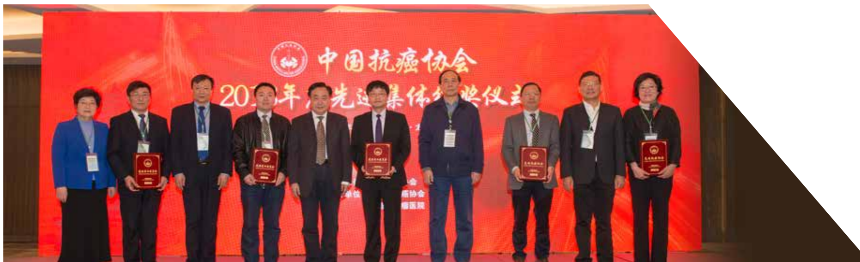
中国抗癌协会 2018 年度先进集体颁奖仪式