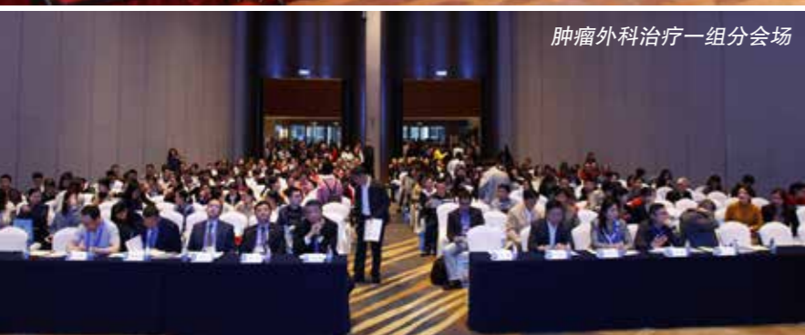
肿瘤外科治疗一组分会场