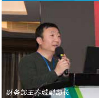
财务部王春城副部长