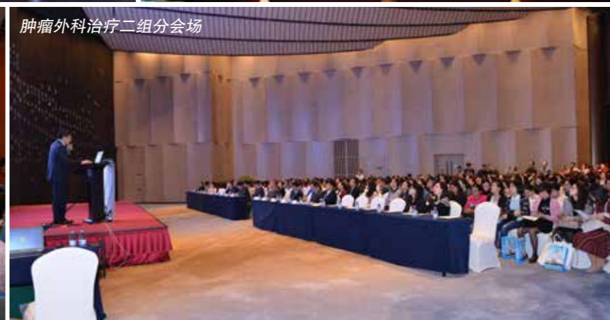
肿瘤外科治疗二组分会场