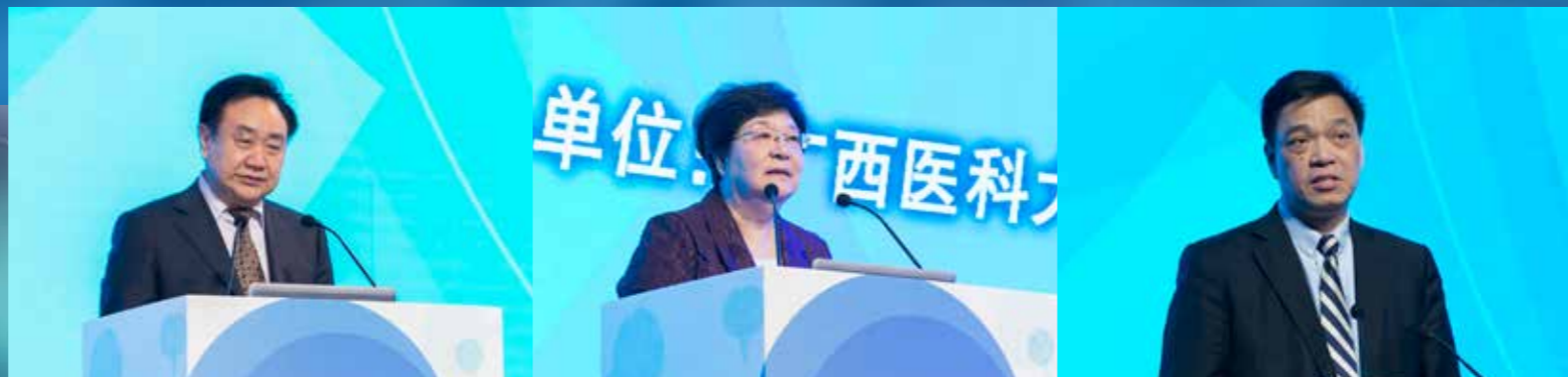
中国抗癌协会理事长樊代明院士致辞

3月27-28日，万众瞩目的“2019中国肿瘤学大会（CCO）主旨报告遴选暨中国肿瘤新进展研讨会”在绿城南宁隆重召开。活动由中国抗癌协会主办，广西医科大学附属肿瘤医院、广西抗癌协会承办。中国抗癌协会理事长樊代明院士，中国抗癌协会名誉理事长、监事长郝希山院士等专家出席活动。大会盛况空前，92位肿瘤领域大咖共做了108场次精彩的学术报告，西南地区近5000名参会代表汇聚一堂，共襄盛会。