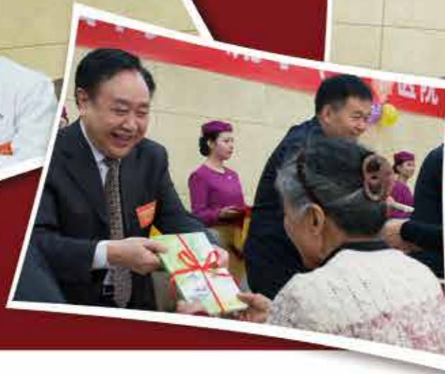
为“阳光榜样”赠送书籍和爱心礼物