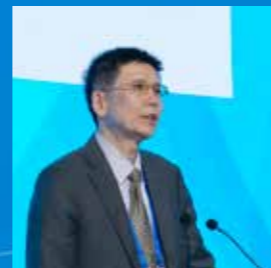
海军军医大学东方肝胆外科医院 丛文铭教授