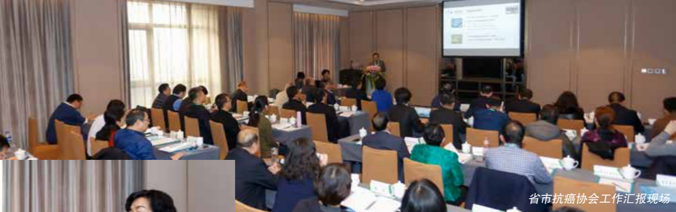
省市抗癌协会工作汇报现场