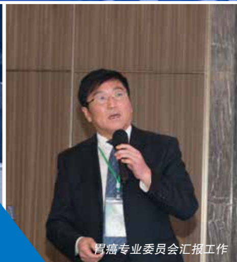
胃癌专业委员会汇报工作