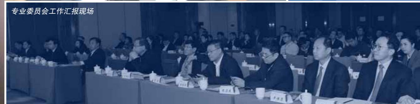
专业委员会工作汇报现场