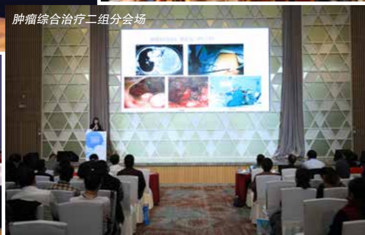
肿瘤综合治疗二组分会场