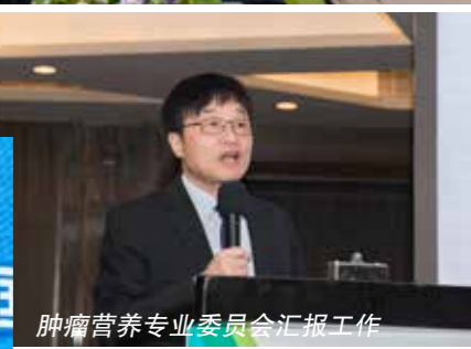
肿瘤营养专业委员会汇报工作